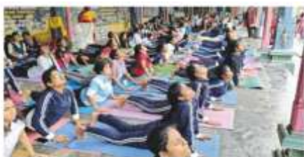
குந்தூர் அருகில் சூரியனார் கோயிலின் புனிதமான வானூழல் வற்றல் இடத்தில் நடைபெற்ற 'MASS SURYA NAMASKAR' कार्यक्रम में हजारों योग प्रेमी शामिल हुए।

Wider publicity was given by the local newspapers.